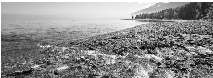
На Байкале нет места пластику!