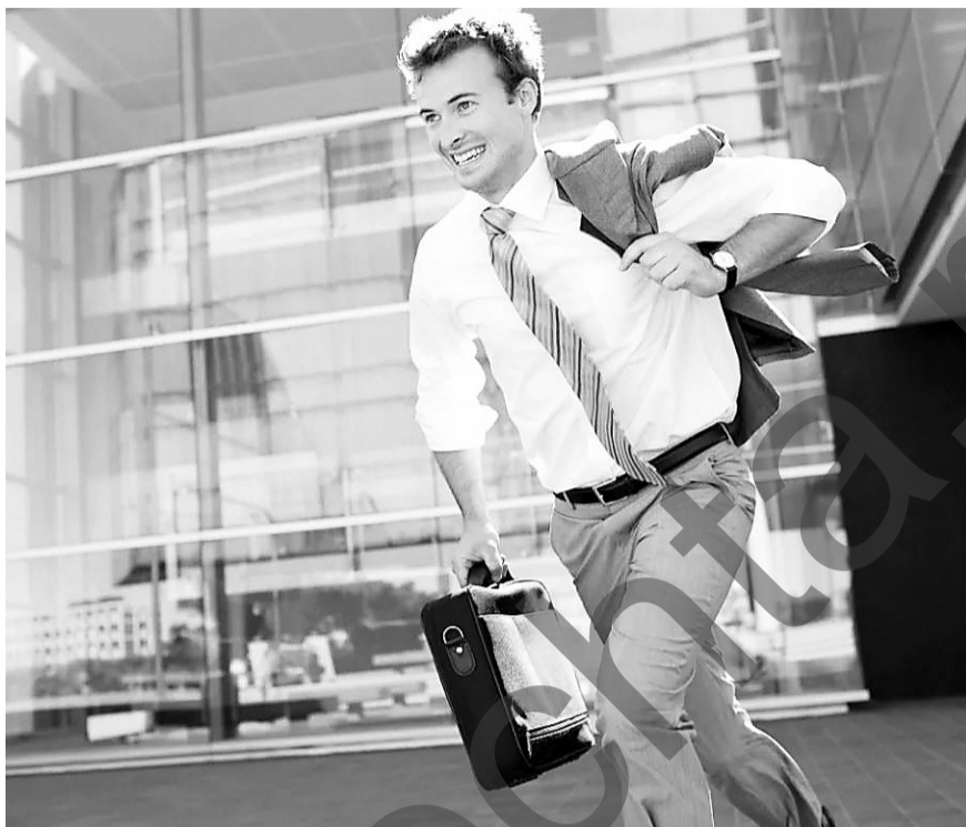
Убежать от гнева? Вполне реально!