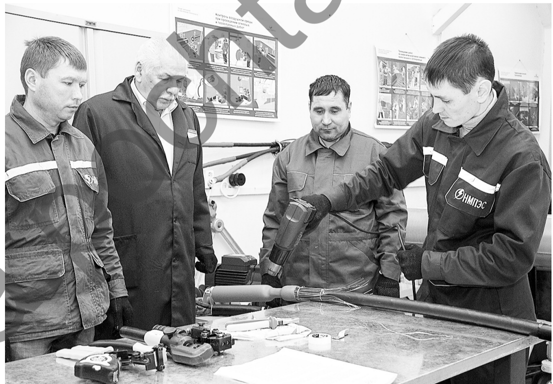
Качество обучения зависит от технических возможностей образовательной организации

С началом учебного года вступают в силу (за исключением некоторых положений) новые Правила обучения по охране труда и проверки знания требований охраны труда. Документ устанавливает обязательные требования к обучению работников, заключивших трудовой договор с работодателем, к организациям и индивидуальным предпринимателям, оказывающим услуги по обучению, а также некоторые особенности организации обучения по охране труда на микропредприятиях.