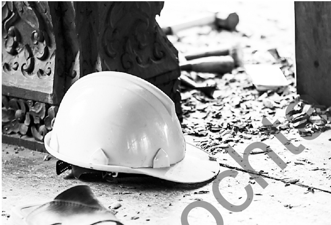
Гострудинспекция доказала, что случай был связан с производством

14-16 июля тепловую камеру, где трудилась бригада, затопило – произошла авария. 17 июля работы было решено продолжить: два монтажника по зада-