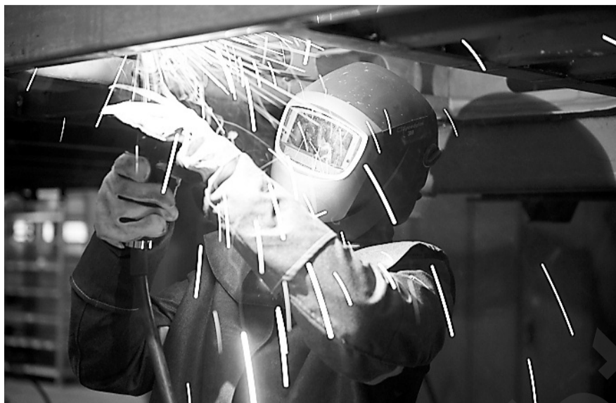
Сохранить здоровье работника поможет комплексная защитная экипировка

Полный комплект защиты сварщика состоит из пяти изделий. В первую очередь это сварочный костюм , который защищает тело человека от искр, брызг расплавленного металла и воздействия повышенных температур. Не обойтись сварщику без щитка , предохраняющего глаза от воздействия дуги, инфракрасных и УФ-лучей, а лицо и голову – от окалины и искр. Респиратор , плотно прилегающий к лицу, призван не пропустить пыль и другие производственные загрязнения, а также защитить от сварочных аэрозолей. Важна для сварщика надежная защита рук. Это обещает краги , не ограничивающие подвижность кисти и пальцев рук и в то же время ограждающие их от воздействия высоких температур и брызг расплавленного металла. И, наконец, защитные ботинки или сапоги , за-