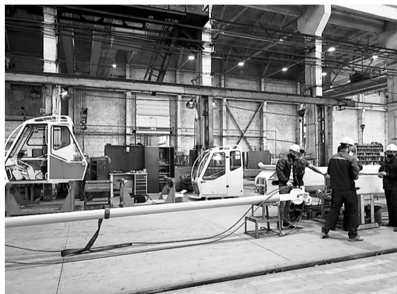
Бережливые технологии помогают оптимизировать производство

Компания «Росинка», производитель воды и прохладительных напитков из Липецкой области, благодаря участию в нацпроекте «Производительность труда» повысила скорость выпуска холодного чая и воды на 40 %. Экономический эффект от внедренных совместно с экспертами Федерального центра компетенций решений составил 51 миллион рублей в год.